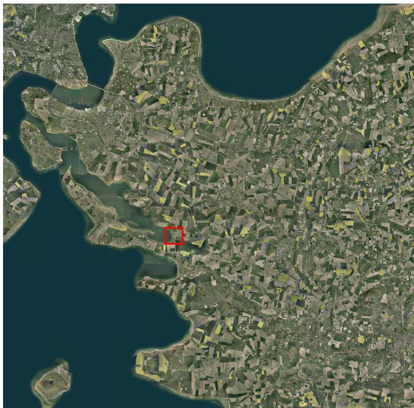
Figur 1: Beliggenheden af Ronæs Camping i Middelfart Kommune.