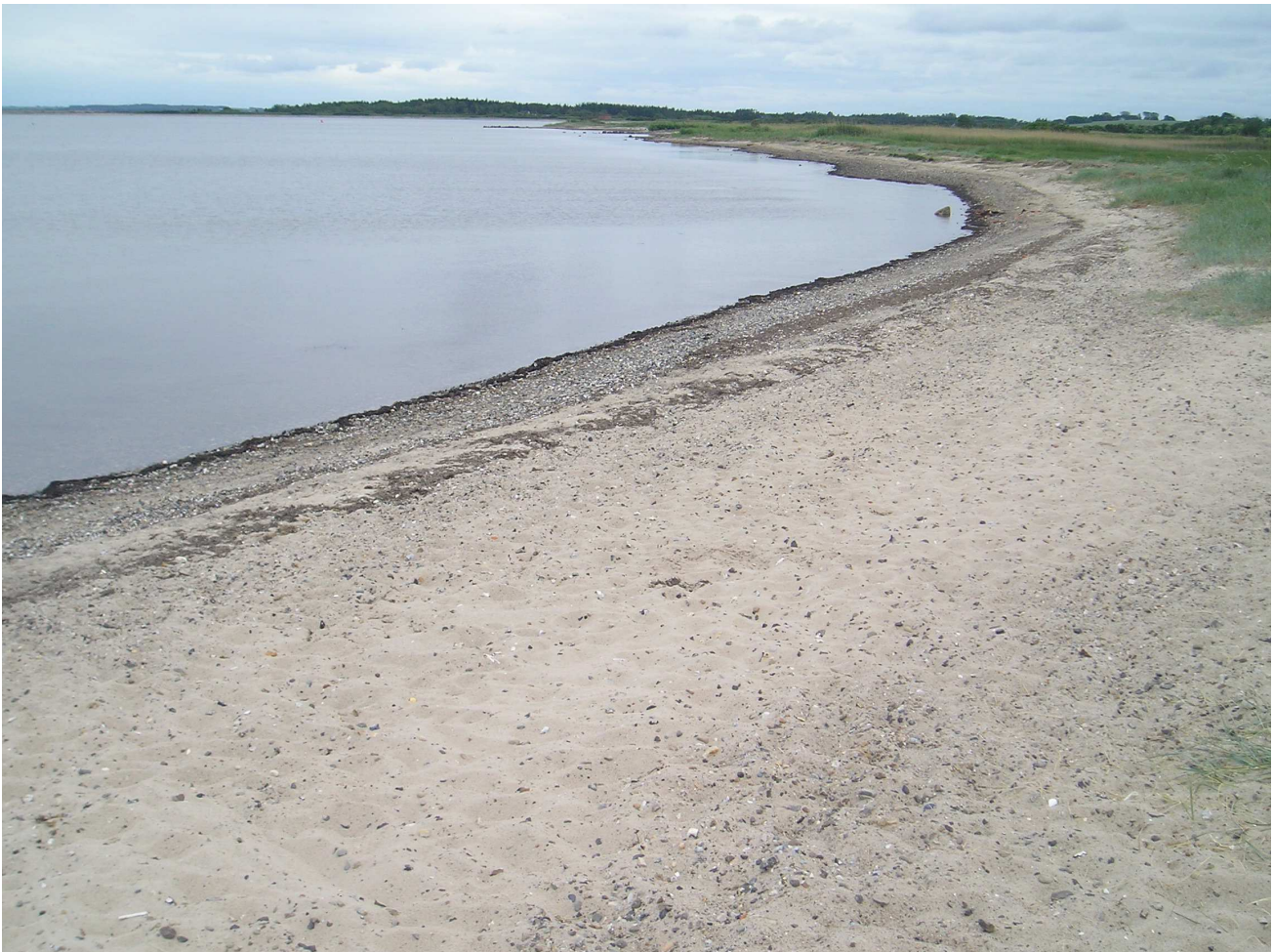
Figur 2: Billede der viser strandens beskaffenhed ved Ørding. Billedet er taget mod syd.