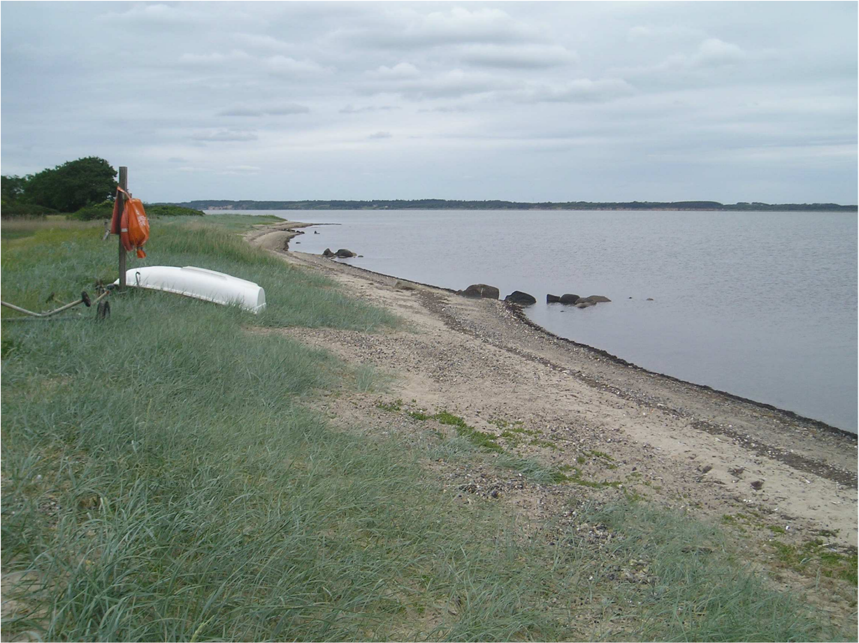
Billede fra stranden ved Ørding med redningspost til venstre i billedet. Billedet er taget mod nord.