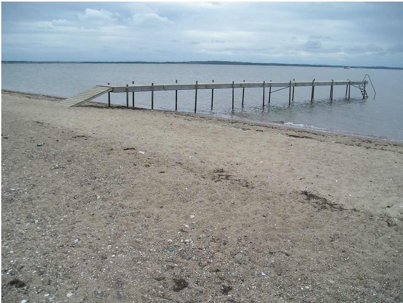
Figur 2: Billede af stranden og badebroen ved Sillerslev Havn.

Stranden er ca. 300 meter lang (se afgrænsningen på oversigtskortet). Det er en bred strand ca. 20 - 25 meter, der primært består af fin sand. Havbunden består også primært af sand, dog iblandet enkelte småsten.