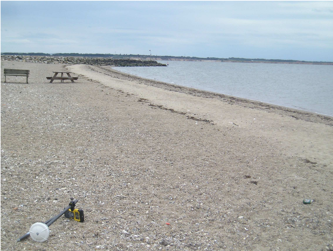
Billede fra stranden ved Sillerslev Havn, set mod øst.