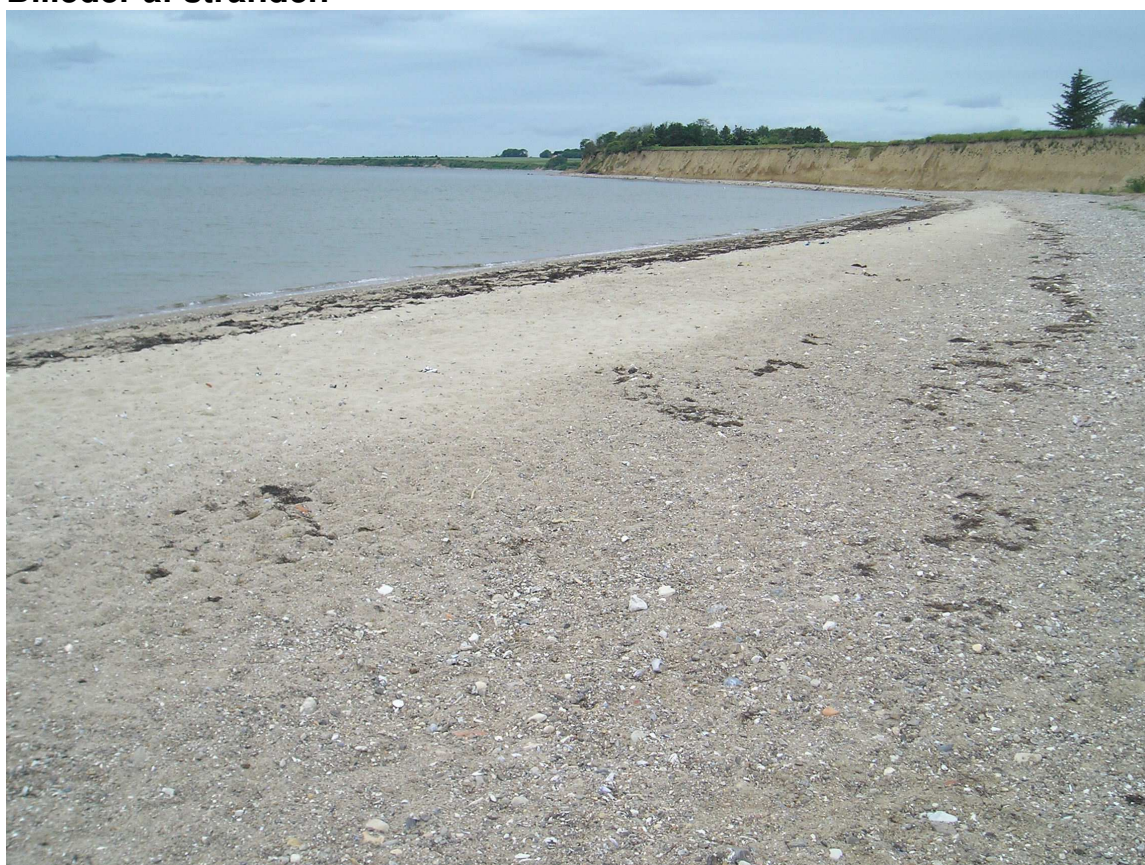
Billede fra stranden ved Sillerslev Havn, set mod vest.