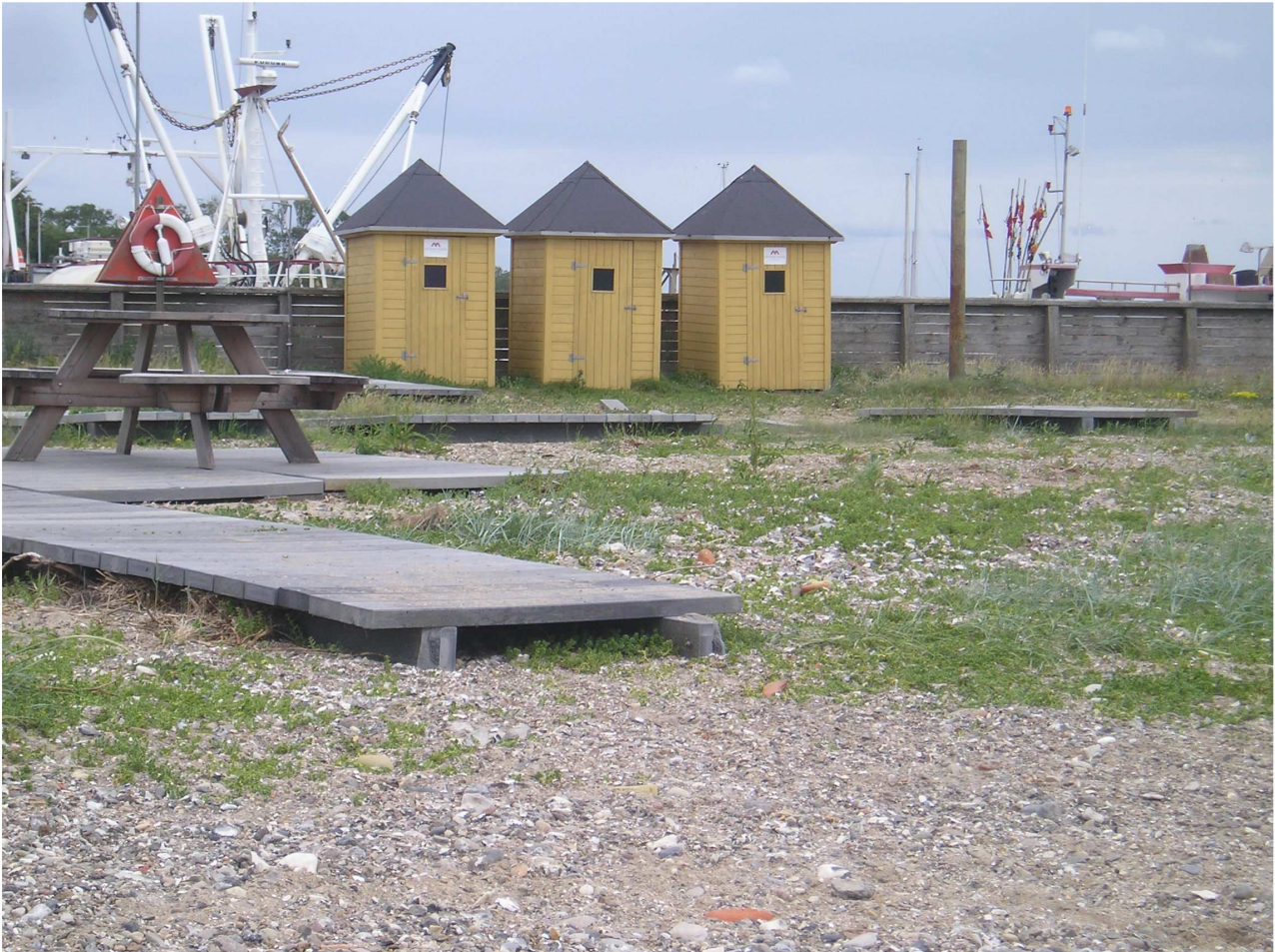
Figur 3: Billede af nogle af faciliteterne ved Sillerslev Havn