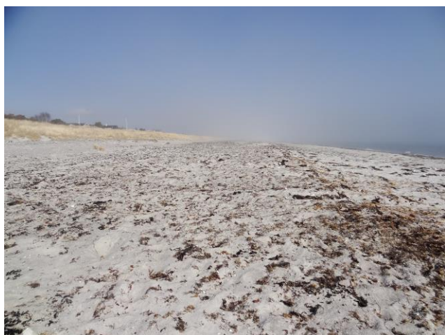
Grenå Strand (apr. 2013)