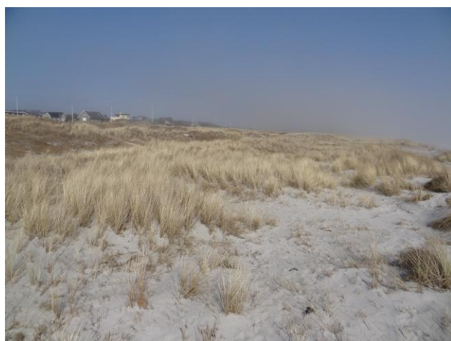
Grenå Strand (apr. 2013)