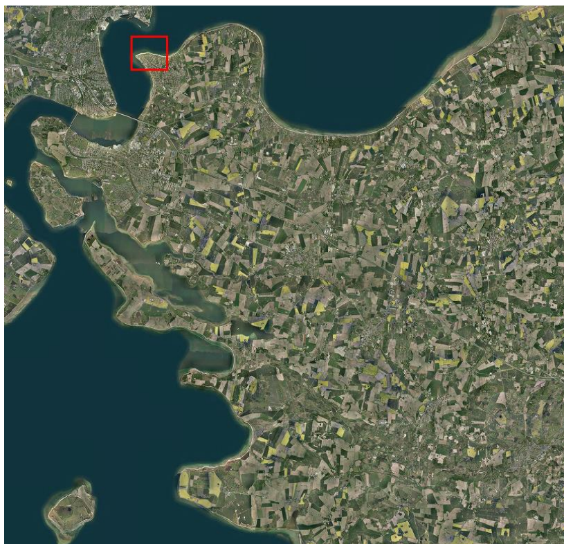
Figur 1: Beliggenheden af Dæmningen