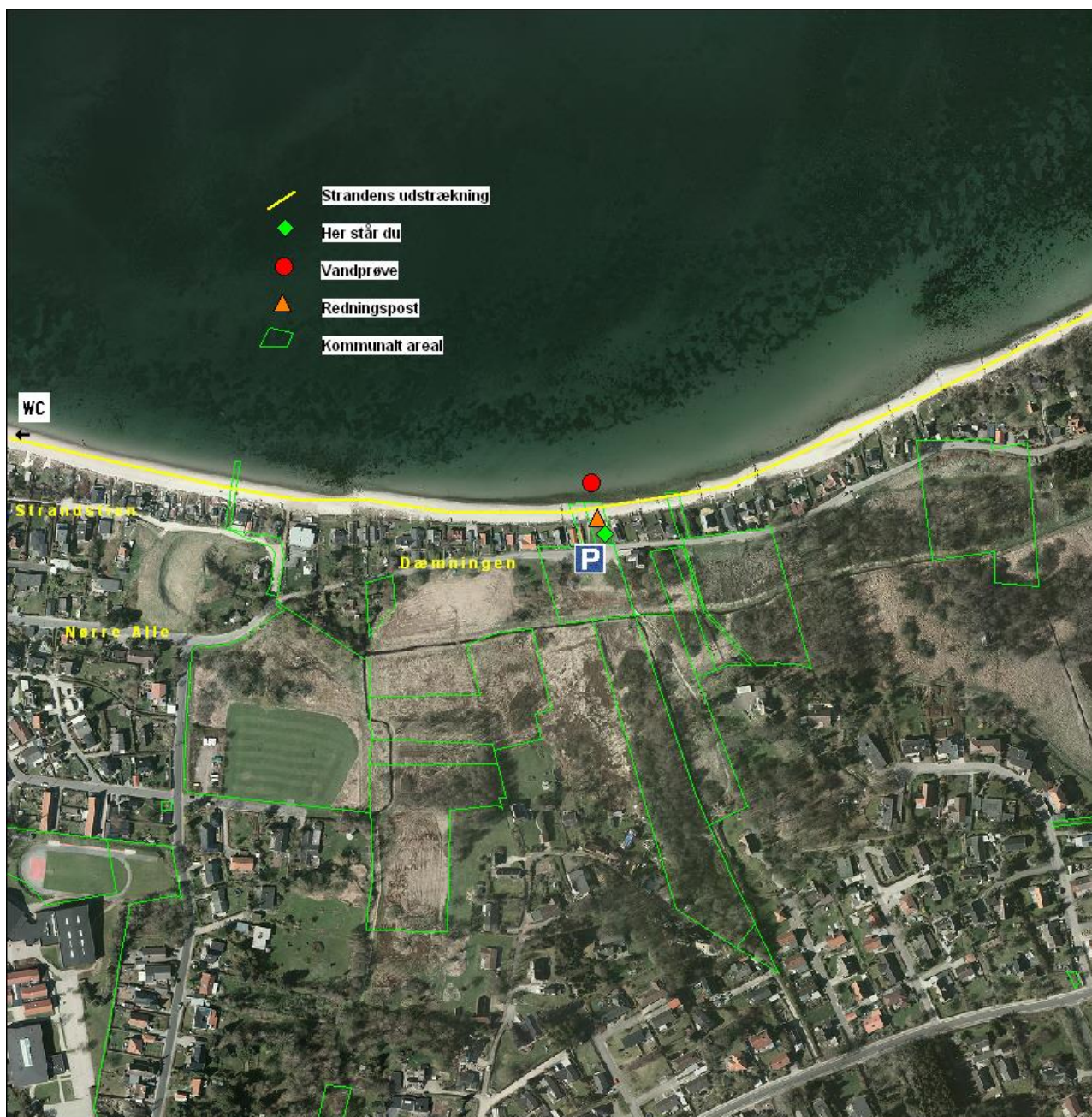
Figur 2: Kort over Dæmningen

Der er toilethus og plads til få biler ved den vestlige del af stranden ved Strandstiens asfalterede del. Der er opsat redningspost, to bænke samt to affaldsspande på det offentlige areal (Dæmningen 47-49), og en parkeringsplads er lige på den anden side af vejen. Der er badebroer med jævne mellemrum.