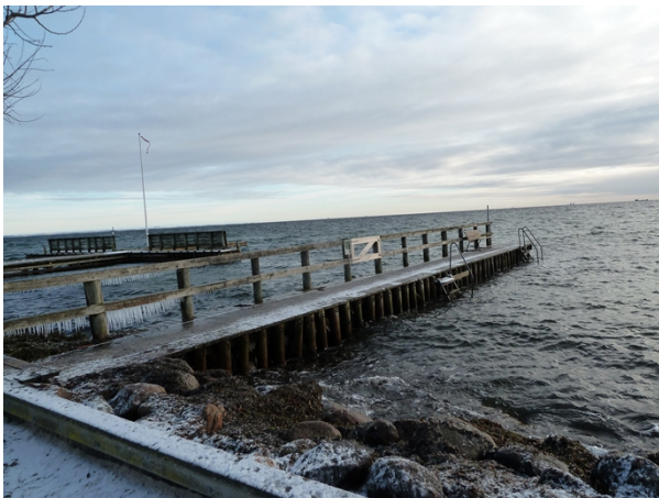
Taarbæk Søbadeanstalt (februar 2011)