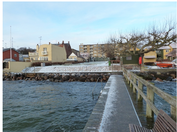
Taarbæk Søbadeanstalt (februar 2011)