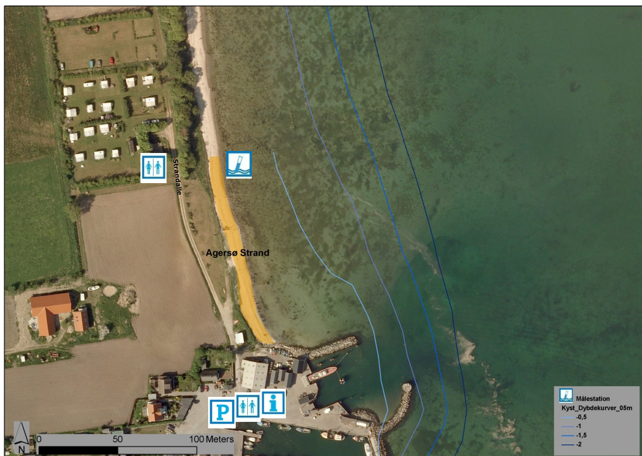
Figur 1. Agersø Strand med dybdekurver (0,5 til 2,0 meter).