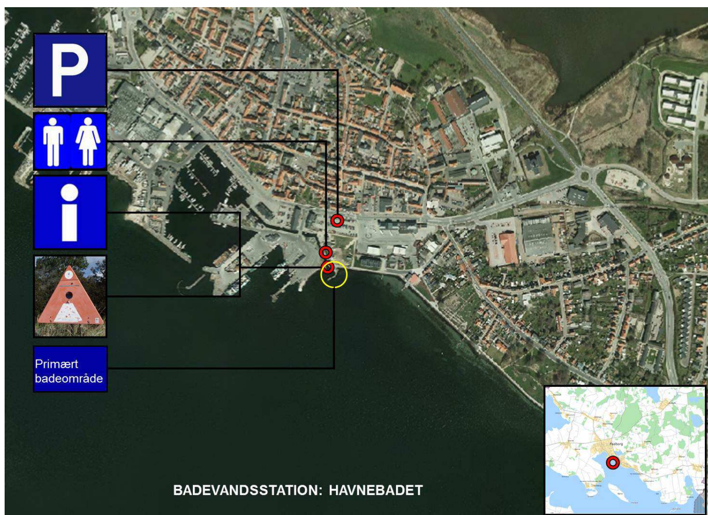
Figur 2. Badestedet med diverse informationer.

Der er borde og bænke i området, som kan benyttes af alle.