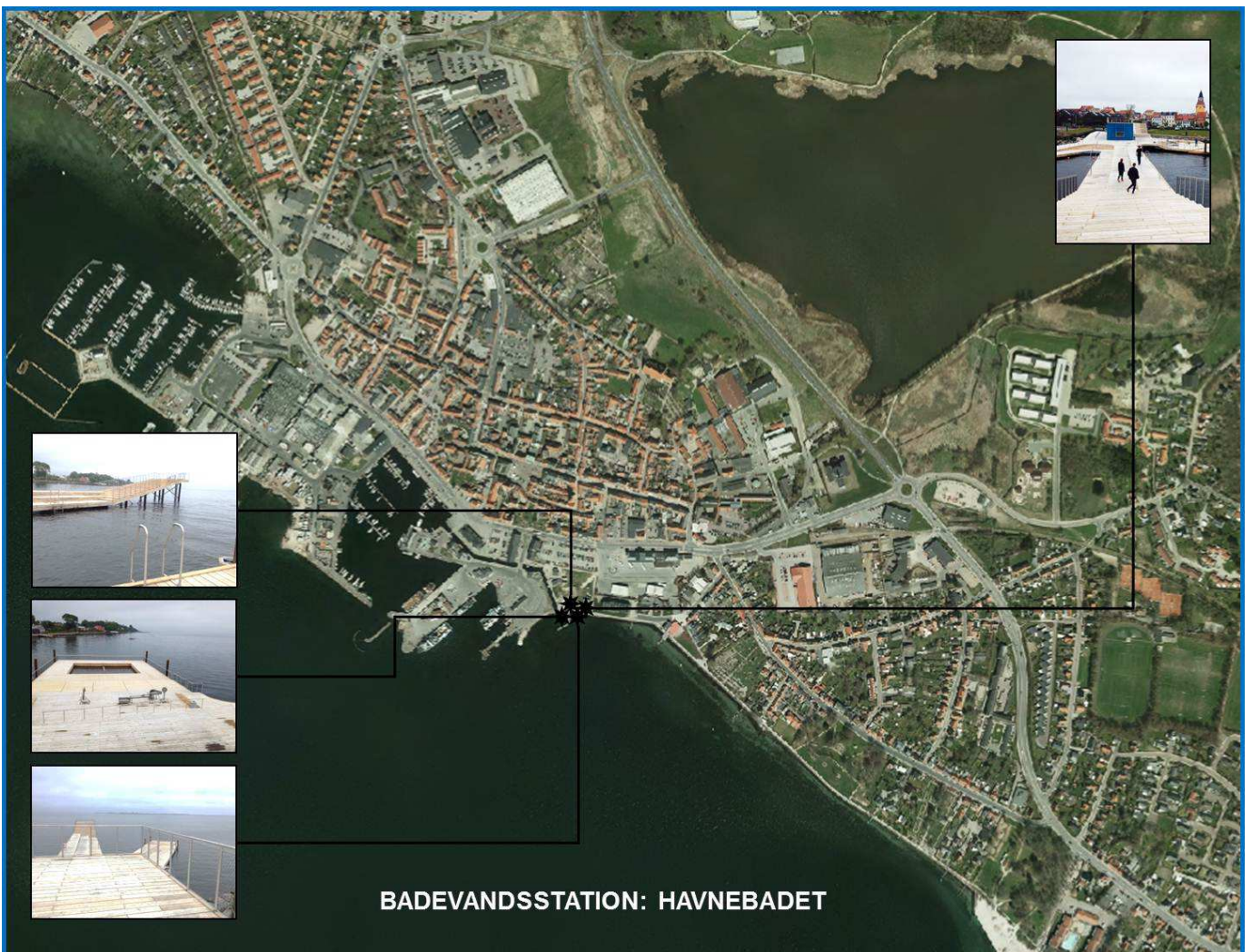
Figur 1. Badestedets placering med billeder taget på badestedet i marts 2014.