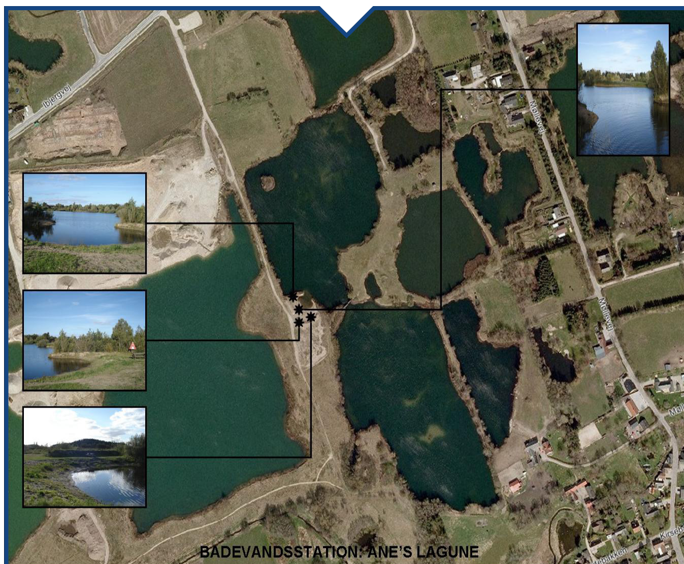
Figur 1: Badestedets placering med billeder taget på badestedet i september 2010.