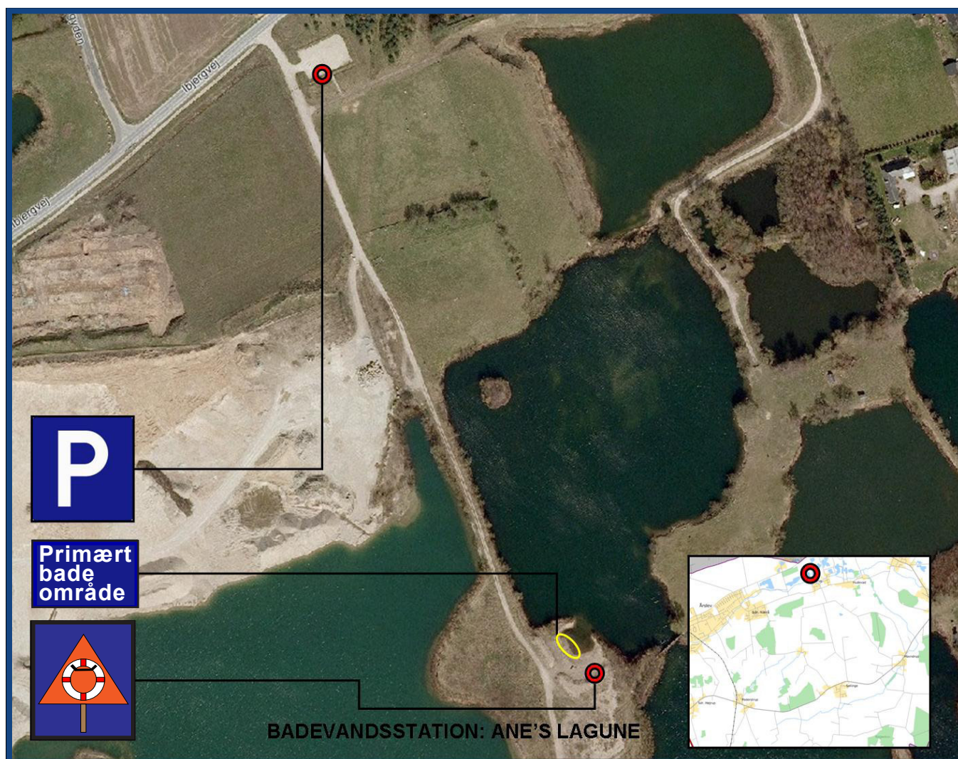
Figur 2: Badestedet med diverse informationer.

Vanddybden er omkring 1,5 meter, hvor lagunen går over i selve søen.