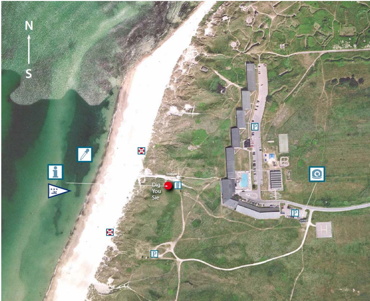
Figur 1: Oversigtskort over Krage strand. Den røde trekant med udråbstegn markerer, hvor der bliver varslet i tilfælde af forringet badevandskvalitet.