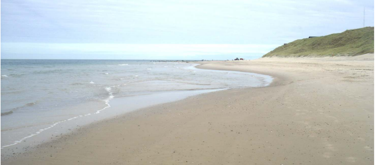
Figur 2: Krage Strand.

Stranden består af fint sand med få små sten. Ligeledes består havbunden ud for stranden af fint sand med få småsten. Stranden er ca. 60 meter bred og ca. 400 meter lang (se afgrænsningen på oversigtskortet).