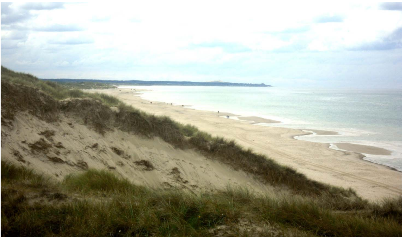
Figur 4: Krage Strand.